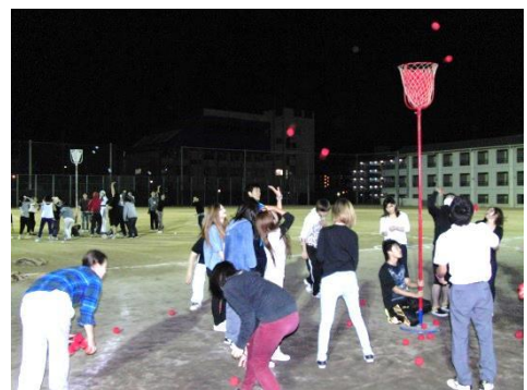
「体育祭。赤勝て、白勝て!」