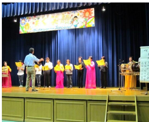
「文化祭の舞台発表」

湊川での高校生活も残りわずかですが、いろいろな意味で、最後までよろしくお願ひします。